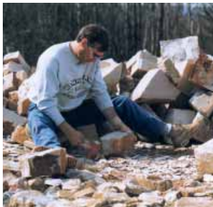
Épincage de moellons