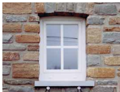
Rahier, arch. P. Dumez, grès