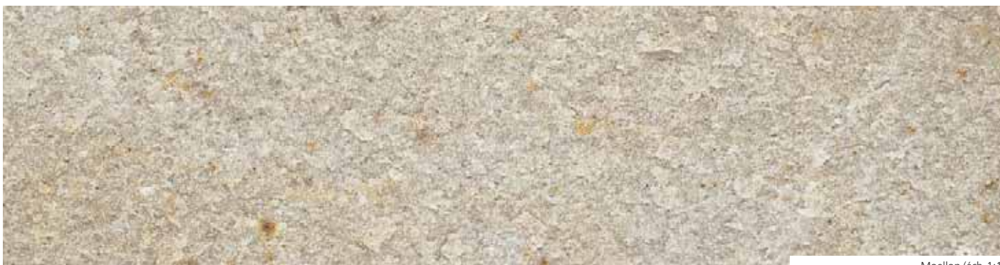
Moellon (éch. 1:1)

L'exploitation de la CARRIÈRE DE STANEUX remonte pour le moins à l'époque romane. La tour de l'église de Theux en est un témoin prestigieux, ainsi que le hameau de Spixhe-Staneux totalement construit en quartzite. On retrouve cette roche claire et inusable dans toutes les maçonneries traditionnelles du pays, au même titre que les autres pierres ardennaises. Quant à la carrière de grès, elle appartient aux grandes séries de CARRIÈRES D'ESNEUX qui ont fourni pendant des siècles des roches aux qualités mécaniques exceptionnelles.