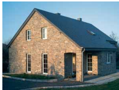
Rahier, arch. P. Dumez, grès

Les épais gisements de grès se déclinent selon une gamme extrêmement variée, avec des teintes plus vives (jaune, vert, rouge, brun rouille) ou plus sourdes (du gris vert au gris bleu, lie-de-vin, ocre, beige). La pierre se patine respectivement en brun rouille lorsqu'elle est riche en fer, et dans les tons gris bleu ou verdâtre lorsqu'elle est riche en feldspaths.