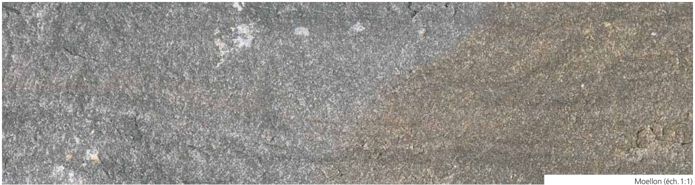
Moellon (éch. 1:1)